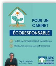
URPS Médecins Libéraux AURA – 13 capsules vidéos + auto évaluation